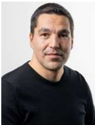
Aqqaluaq B. Egede

Paasiuminartitsinerunissaq innuttaasunullu pitsaanerusumik paasissutissiinissaq Naalakkersuisut kissaatigaat, taamaammallu Inatsisartut ataatsimeereernerisa kingorna nalunaarut Naalakkersuisut.gl-imi tamanut saqqummiunneqarumaarpoq. 2015-imut, 2016-imut, 2017-imut, 2018-imut 2019-imullu nassuiaatit nittartakkamut ikkunneqareerput.