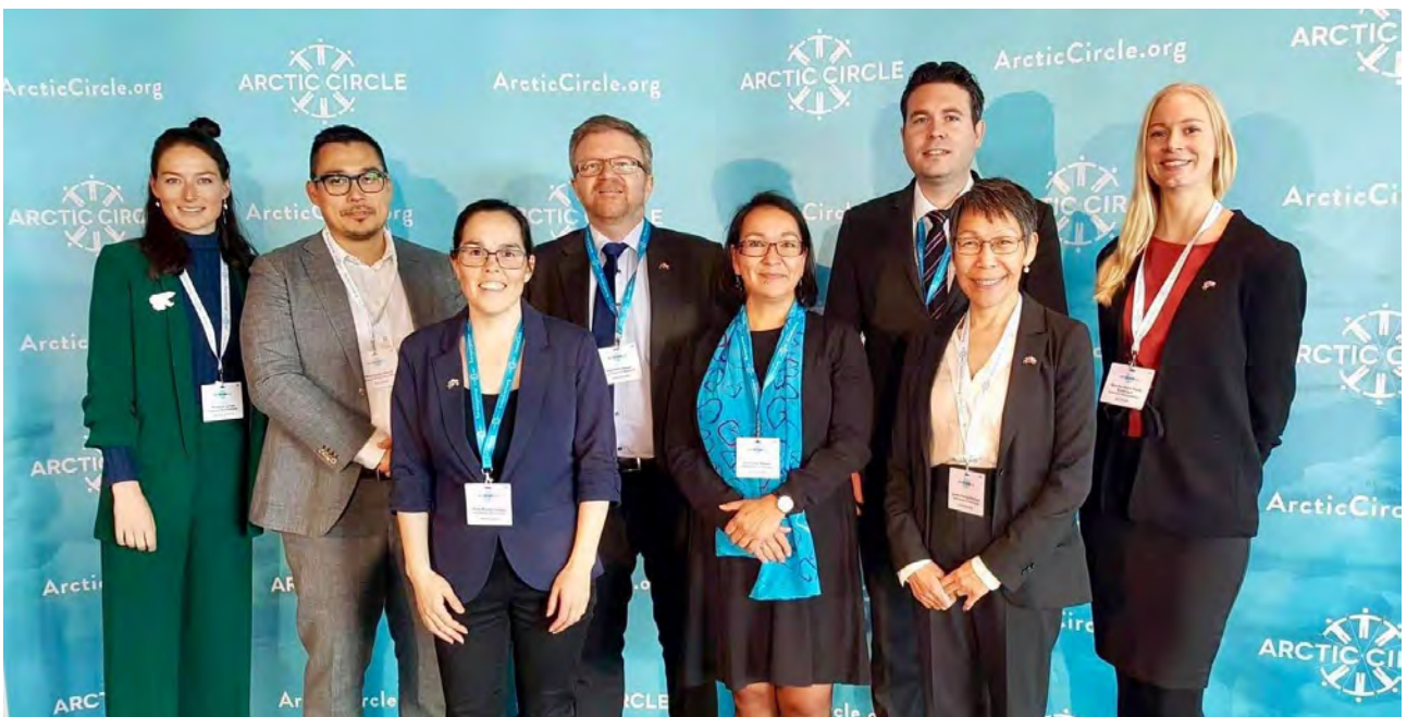
Nunanut Allanut Naalakkersuisoqarfimmiit aallartitat taavalu Washingtonimi Bruxellesimilu Sinniisoqarfinnik aallartitat

Siuliani Arctic Circle Assembly-qarneranut sanilliullugu, Issittumi sillimaniarnikkut politikkeqarneq maluginiarneqarnerulersimasutut isikkoqarpoq. Pingaartumik Ruslandip aamma NATO-p akornanni aaqqiagiingissut kiisalu nunanut allanut issittumullu Kinap politikikkut isoqutiginnileraluttuinnarnera, ataatsimoorfinni, ataatsimiinnermi aaqqissuussinernilu pisup saniatigut ingerlanneqartuni oqallisigineqarput. Minnerunngitsumik soqutigisaqatigiit kangianeersut kitaaneersullu akornanni suleqatigiinnerup qanoq annertussuseqarneranik Arctic Circle Assembly takutitseqataavoq. Tamanna ersarissumik takuneqarsinnaavoq, assersuutigalugu illersorneqarsinnaasumik nungusaataanngitsumik nunat tamalaat ilisimatusarnerat ingerlanneqartoq, issittumi qulequttat assigiiaartut pillugit soqutigisaqatigiinnermit aallaaveqartoq.