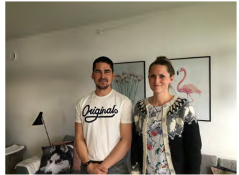
Aappariit Lund Qanisartuumi savaatillit

Ilinniartitaanermut, aningaasaqarnermut makromik, pisortallu pisiortuisarnerinut aalajangersakkut pillugit saqqummiussinerit eqqaassagaanni, kommunit kommuniminni pissutsit suliniutitillu saqqummiuppaat. Saqqummiussinerit nuna tamakkerlugu ineriartornerit takutippaat, taavalu aamma kommunini ataasiakkaanni pissutsit. EU-p suleqatigiinnissamik isumaqatigiissutip Nunat imarpiup akianiittut nunasiaataasimasullu aaqqissuussinerat siunissami ataatsimuulernissaannut pilersaarutaat Europa-Kommissionip saqqummiuppaat.