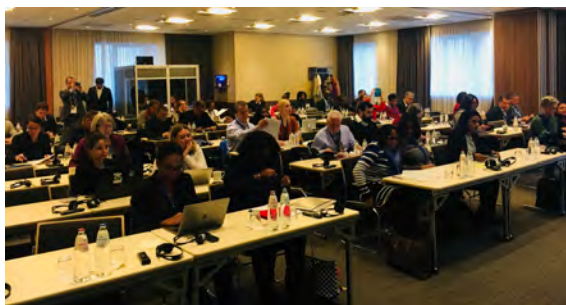
Deltagere til OCTA Workshop

OCTA Workshopen fandt sted d. 21-22. november 2018, hvor repræsentanter fra Illisimatusarfik, Departementet for Uddannelse, Kultur og Kirke, Naturinstituttet, Sermersooq Kommune, foruden Grønlands Repræsentation i EU var til stede. I erkendelse af manglen på OLT'ernes deltagelse i EU-programmer, havde OCTA EU-program workshopen til formål at belyse hvordan OLT'ernes deltagelse kunne øges. Derfor blev 3 interessenters deltagelse fra hvert OLT-land sponsoreret af OCTA. Der var en del fokus på hvilke EU-programmer, OLT-landene har adgang til. De medvirkende repræsentanter fra OLT-landene var overordnet enige om, at deltagelse i EU-programmerne bør gøres lettere tilgængeligt for OLT-landene. Det blev endvidere diskuteret, at der bør udarbejdes et webseminar, som vil kunne hjælpe OLT-landene med ansøgningsprocesserne samt at OCTA også næste år afholder en lignende workshop mhp. at øge OLT'ernes medvirken i EU-