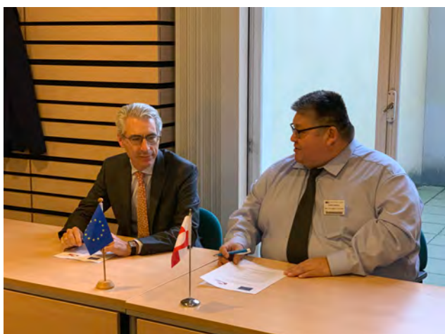
Forhandlingslederne gør sig klar til at skrive under på forhandlingsresultatet

Fra Europa-Kommissionens side repræsenterer General-direktoratet for Maritime Anliggender og Fiskeri, DG MARE, EU. Derudover deltager repræsentanter fra interesserede EU-medlemsstaterne, herunder Frankrig, England, Tyskland, Danmark og andre på EU's side.