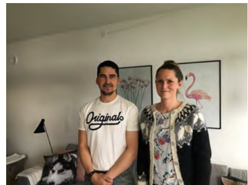
Ægteparret Lund fåreholdere i Qanisartuut

Udover uddannelsesrelaterede, makroøkonomiske samt offentlig indkøbsrelaterede præsentationer, præsenterede Kommunerne forhold og initiativer indenfor deres kommuner. Præsentationerne gav således et billede af udviklingen på landsplan, samt af forholdene lokalt. Europa-Kommissionen præsenterede EU's planer om en sammenskrevet partnerskabsaftale med OLT-ordningen.