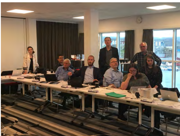
Den grønlandske delegation til Policy Dialogue

Under de tre dages møder, blev der også tid til en ekskursion til bygden, Igaliku, hvor EU delegationen kunne se forholdene på en skole i en fåreholder-bygd. På vejen tilbage til Qaqortoq, blev der ligeledes mulighed for at besøge Qanisartuut, som er et fåreholdersted, hvor der foregår hjemmeundervisning.