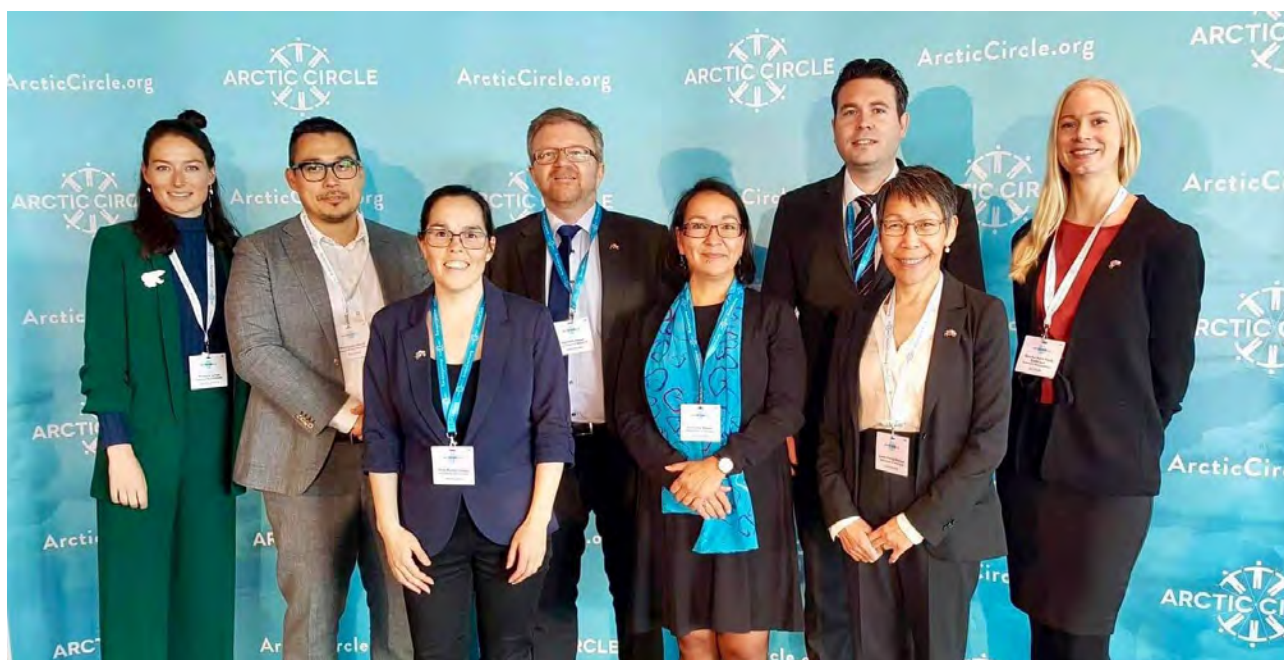
Repræsentanter fra Departementet for Udenrigsanliggender samt repræsentationerne Washington og Bruxelles

Sammenlignet med forrige Arctic Circle Assemblys synes sikkerhedspolitik i Arktis at have fået øget opmærksomhed. Især konflikten mellem Rusland og NATO samt Kinas stigende politiske interesse for omverdenen og Arktis blev diskuteret ved de sideløbende sessioner, møder og events. Ikke desto mindre er Arctic Circle Assembly med til at vise omfanget af samarbejde mellem interessenter fra øst og vest. Dette kan tydeligt iagttages ved f.eks. den substantielle transnationale forskning der finder sted, bundet i fællesinteresser om arktisk relaterede emner.