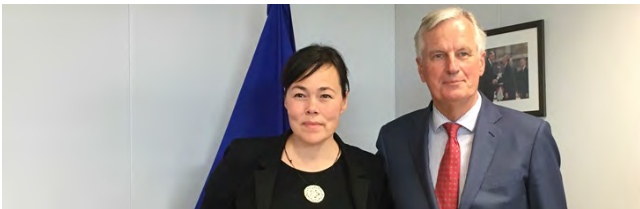
Daværende Naalakkersuisoq Vivian Motzfeldt mødtes med Chefforhandler for Brexit, Michel Barnier