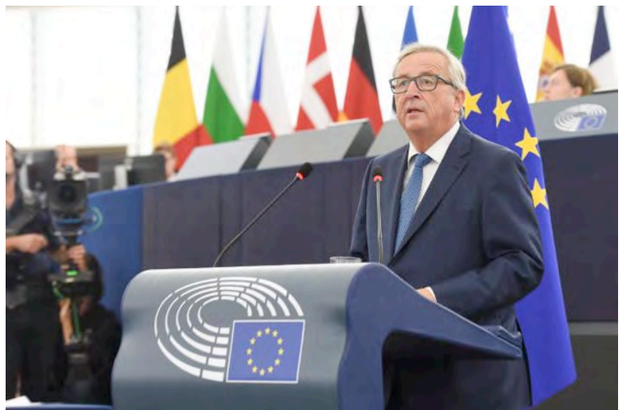
Siulittaasoq Jean-Claude Junckeri Europa-Parlamentimi oqalugiartoq.

Jean-Claude Junckerip tassunga ilannguppa nammineq oqaatigissaguniuk ullumikkut Peqatigiiffimmi pissutsit pitsaanerujussuunngitsut. EU-p suliffeqarfii, taakkua akornanniilluni Bruxellesimi Kalaallit Nunaata Sinniisoqarfia toqqaannartumik aallakaatitsinnikkut siulittaasup Peqatigiiffiup qanoq issusia oqaatiginiarneraa aamma siunissamut suut pilersaarutaanersut tusarniarlugit pissangallutik malinnaapput.