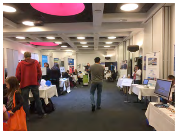
Assi: Århusimi suliffissanik saqqummersitsineq