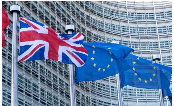
Kunngearfeqatigiit erfalasuat.

2017-imi marsip naannginnerani EU-mit anineq pillugu Lissabonimi isumaqatigiilluni aalajangersakkami immikkoortortaq 50 aallartissallugu ministeriunerup Theresa Mayip oktobarip aallartinnerani nalunaarutigaa. Isumaqatigiilluni aalajangersakkami immikkoortortaq 50-ip EU aamma tuluit ukiuni marlunni ileqqusumik isumaqatigiinniarsinnaatippai. Tassa imaappoq Mayip pilersaarutai malillugit ingerlassappat ilimanarpoq UK 2019-ip qeqqani EU-mit anisimassasoq. Taamaattorli maanna nalunaarutigineqarpoq tuluit nunaanni nunap eqqartuussisuuneqarfiata aalajangeraa immikkoortortap 50-ip aallartinnissaa pillugu apeqqummi tuluit Inatsisartuisa ilanngutitinnissaannut tuluit naalakkersuisui pisussaaffeqartut.