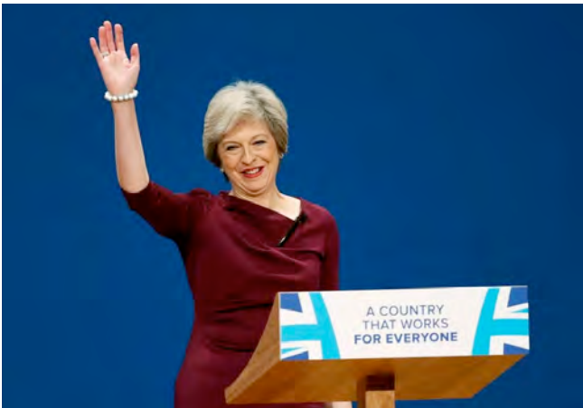
Theresa May

Kunngearfeqatigiit (UK) Europamiut Peqatigiiffiat qimanniarlugu ulloq 23. juuni 2016-imi taasipput, taamanili qanoq pisoqarsimava?