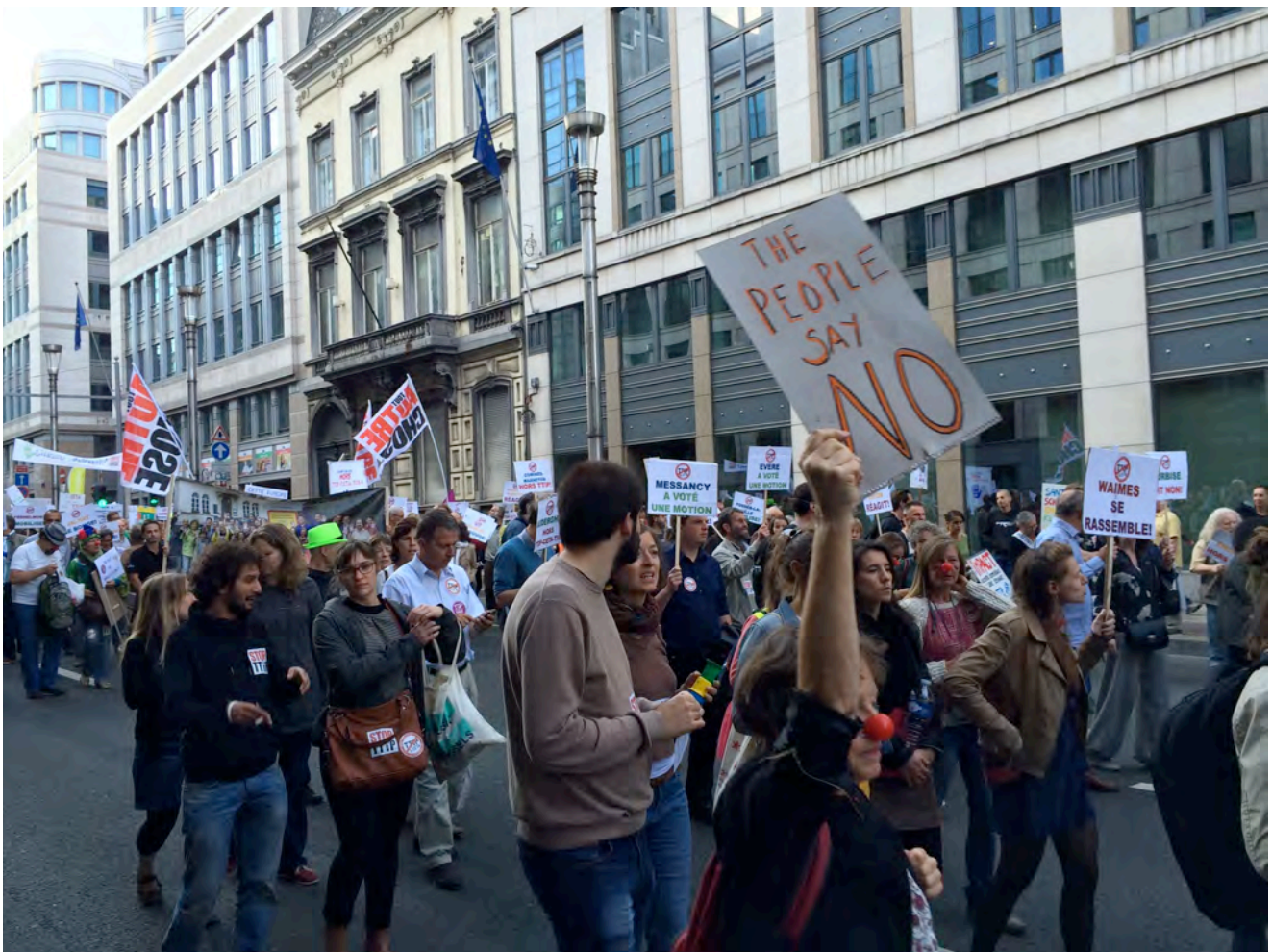
Assit: CETA-mut TTIP-mullu Rue de la Loimi, Bruxelles, akerliussutimik takutitsineq