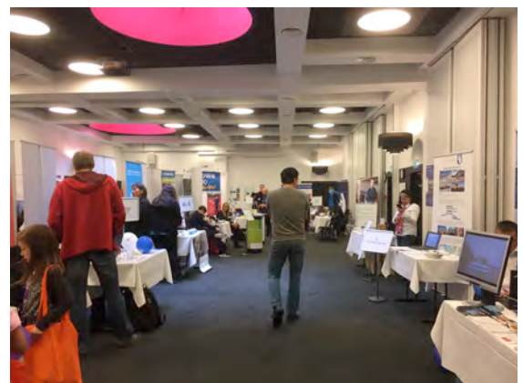
Foto: Jobmessen i Århus