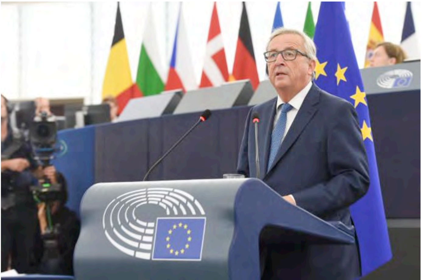
Formand Jean-Claude Juncker holder State of the Union-tale i Europa-Parlamentet.

Således indledte Formand for Europa-Kommissionen Jean-Claude Juncker den årlige State of the Union -tale d. 14. september 2016.