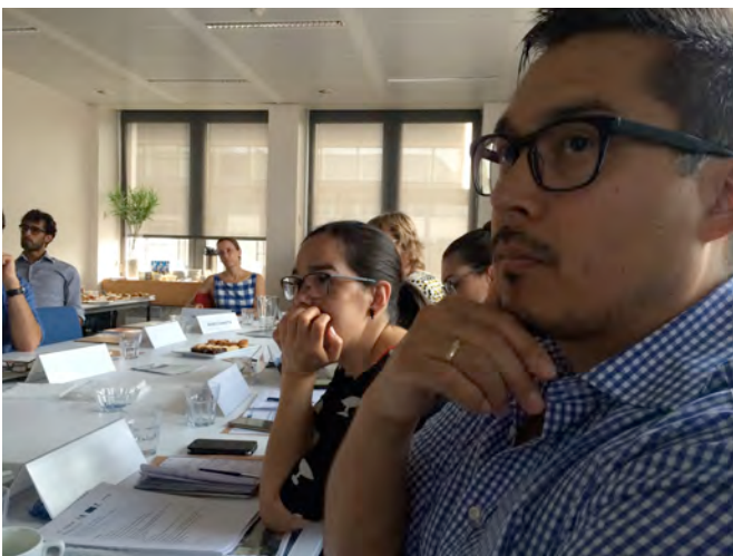
Foto: Uiloq Mulvad Jessen og Mininnguaq Kleist lytter til en præsentation om Arctic shipping