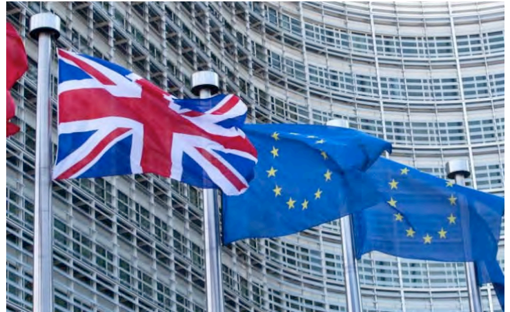
Det Forenede Kongeriges flag og EUs flag.

Premierminister Theresa May meddelte i starten af oktober at hun vil aktivere artikel 50 i Lissabontraktaten om udmeldelse af EU inden udgangen af marts 2017. Traktatens artikel 50 giver EU og briterne 2 år til formelle forhandlinger. Det vil sige, at hvis det kørte efter Mays planer kunne UK potentielt være ude af EU i midten af 2019. Det er dog nu meldt ud at den britiske landsret har afgjort at den britiske regering er forpligtet til at inddrage det britiske Parlament i spørgsmålet om aktiveringen af artikel 50. Sagen er nu gået videre til højesteret og vil blive behandlet mellem 5.-8. december 2016. Hvis May taber sagen vil processen taget noget længere tid og det kan give EU-tilhængerne i Parlamentet mulighed for at stille særlige krav til mandatet for UK's forhandlerteam, og i yderste konsekvens blokere for landets udmeldelse af EU. Det sidste er dog nok mere usandsynligt.