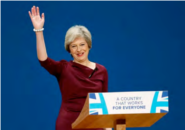
Theresa May

Det Forenede Kongerige (UK) stemte den 23. juni 2016 for at forlade den Europæiske Union, men hvad er der egentlig sket siden?