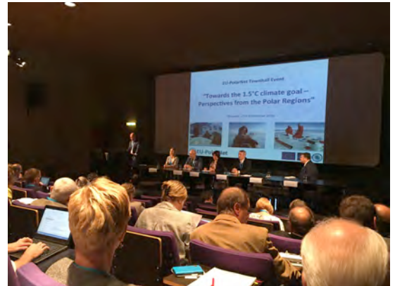
Foto: Tero Vauraste fra Arctia Shipping, Helsinki fremlægger sin præsentation