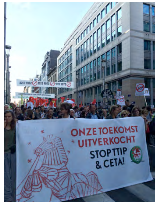
Billeder: Demonstrationer mod CETA og TTIP på Rue de la Loi, Bruxelles