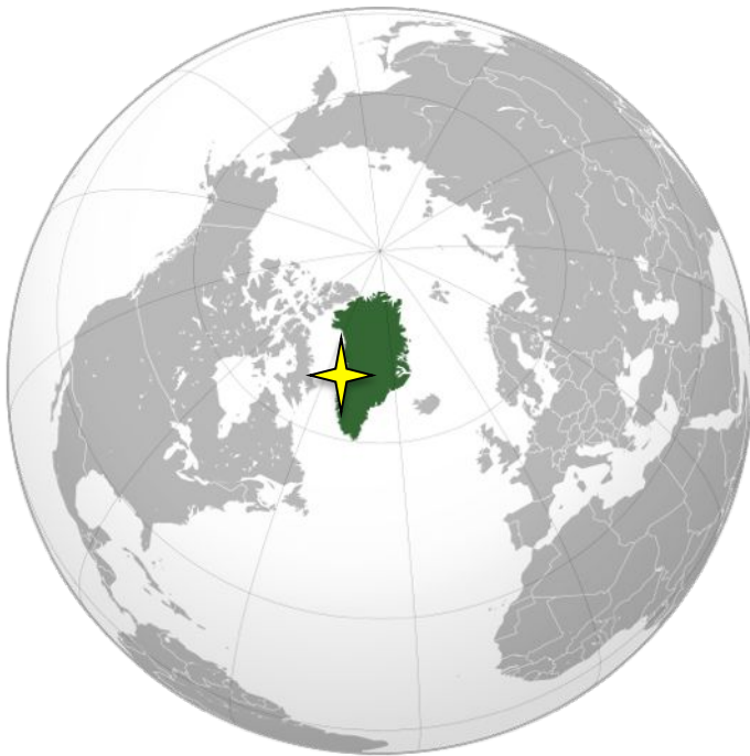
Takussutissuaq 1.2 - Suliniutp inissisimaffia Kalaallit Nunaata Kitaata sineriaani

ingerlanneqassaaq qillerinikkut aamma qaatiterinikkut nunap qaavanik nunap qaavanik imaluunniit ujaqqanik piiaanissaq pisaiqaqassanngilaq. Piffissaq tamakkerlugu atorfiit 30-t missaat naatsorsuutigineqarpoq aatsitassarsiorfimmi ingerlatsinermi pisariqatinneqassasut. Paarlagaallutiksulisut marlukkaartut ilanngutereerlugit, inuit 57-it missaat pisariaqartinneqarput, ilagalugit suliassinneqartartunut suliffissat qulit (10). Aatsitassarsiorneq ukiumut qaammatit qulingiluat ingerlanneqartassaaq kisianni suliaqarfittut sanaartugaq ukiumut qaammatit qulit ingerlanneqartassaaq. Hudson.ip anguniagai sulisut minnerpaamil 80%-inik (imaluunniit sulisut 46-it) kalaallinik sulisoqarnissaq. Aatsitassarsiorfiusinnaanera naatsorsuutigineqarpoq ukiut 20-it sinnissagai.