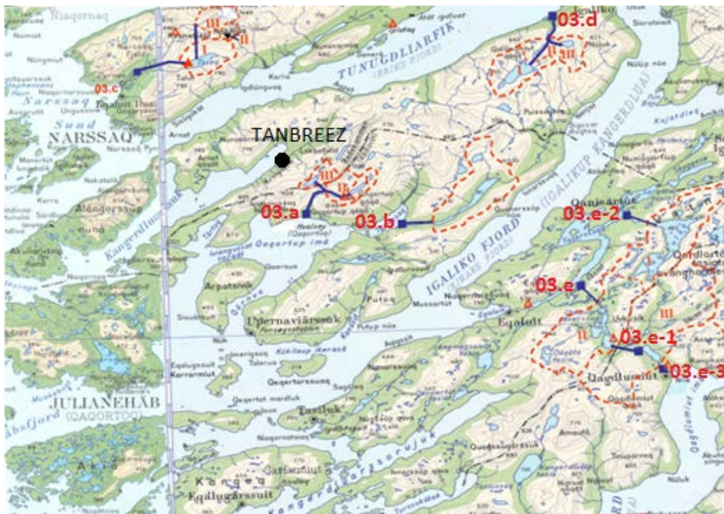
Takusassiaq 2 – Imermik pisuussuteqarfiit immikkoortumi TANBREEZ-ip eqqaani.

Nunap assinga ataani, Takusassiaq 2, qulaani misissuinermik taaneqartumit tigusaavoq.