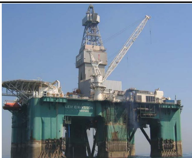
Fig. 3 Borerig (Ocean Rig Leiv Eiriksson)