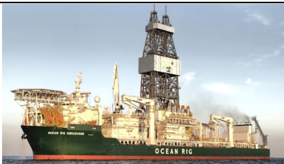
Fig. 2 Boreskib (Ocean Rig Corcovado)

En række fartøjer såsom forsynings- og beredskabsskibe samt ishåndteringsfartøjer anvendes som support og beredskab under operationerne. Et »lagerskib« leverer offshore-opmagasinering og nødopholdsfaciliteter. Der anvendes helikoptere og fastvingede fly til transport af personale til og fra feltområdet, til supportfaciliteterne og til den internationale lufthavn i Kangerlussuaq. Det er planlagt at anvende onshore-faciliteter i Nuuk og Aasiaat som support for boreoperationerne i de forskellige offshore-arealer.