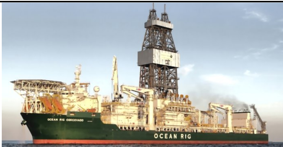
Fig. 2 Boreskib (Ocean Rig Corcovado)

En række fartøjer såsom forsynings- og beredskabsskibe samt ishåndteringsfartøjer anvendes som support og beredskab under operationerne. Et »lagerskib« leverer offshore-opmagasinering og nødopholdsfaciliteter. Der anvendes helikoptere og fastvingede fly til transport af personale til og fra feltområdet, til supportfaciliteterne og til den internationale lufthavn i Kangerlussuaq. Det er planlagt at anvende onshore-faciliteter i Nuuk og Aasiaat som support for boreoperationerne i de forskellige offshore-arealer.