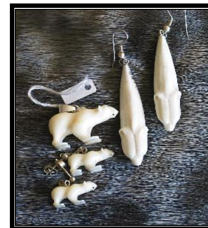
Naalackersuisut CITES-ip allaffia