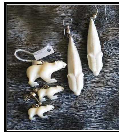
Naalackersuisut CITES-ip allaffia