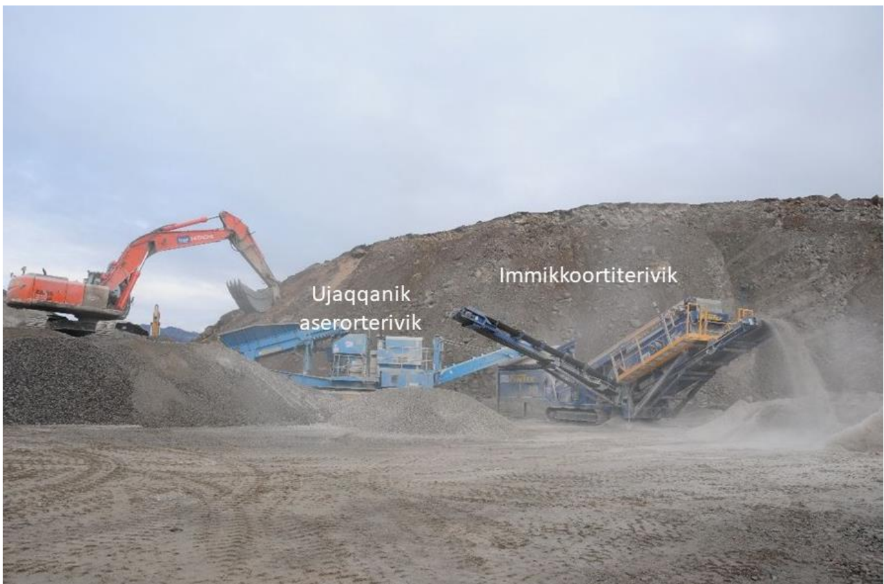
Takussutissaq 1 Ujaqqanik aserorterivik immikkoortiterivillu Ilulissani imermik nukissiorfiliornermi atorineqartut.

Takussutissaq 1-imi takutinneqarput ujaqqanik aserorterivik immikkoortiterivillu Ilulissani imermik nukissiorfiliornermi atorineqartut.