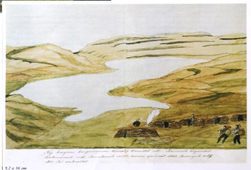
Fig.4 Aalut Kangermiup illut ujaqqanik sanaat takusimasani qalipassimavai oqaasertalerlugillu qangarsuaq inuunngikkallaramili atugaasimassasut. Aalut 1869-imi 47-nik ukioqarluni toquvoq, ilimanarsinnaavoq illukut – ikorsimmaviit taakku siulitta Thule kulturimeersut nuup eqqaanut 1300-kunni peqqaaramik atortarsimasaat imaluunniit inuit allat?

Tarsartuup Tasersuani qaqisariaani piupput Ujarassuit, qallunaatsiaaneersut Anavik (assiliartaq 5). Qangarsuarnitsamit h vdingeqarfik oqaluffeqarsimavoq Nuup Amerallillu kangerluini oqaluffiit marluusut aappaa tassaniilluni, tamannalu qallunaatsiaat Vesterbygdenimiittut allagaataanni oqaatigineqartarpoq taannalu aqqutigalugu ilisimavarput Thule Inuit taakkualu kulturikkut naapeqatigiissimasut. Anavimmi qallunaatsiaat illukuat aserfallassimanginnerpaaq piuvoq Nuup Kangerluani, illu qammagaq iluitsupajaaq (assiliartaq 6). Tupinnaannartumik itsarnisarsiut 1932-mi iliveqarfiusimasumi annertunngitsumik assaanerminni nassaarigamikku qallunaatsiaq suli amilik, nujalik atisalillu kisiannili qaqereernerata kingorna piioneerutipajartoq (assiliartaq 7). Sinneri timit paniinnarsimasut suli Anavimmi iliveqarfimmi piupput, taakkulu nunarsuarmioqatigiinnut ilisimatuussutsikkut qallunaatsiaqarneranut suliniarnermi atorneqarsinnaagaluarput.