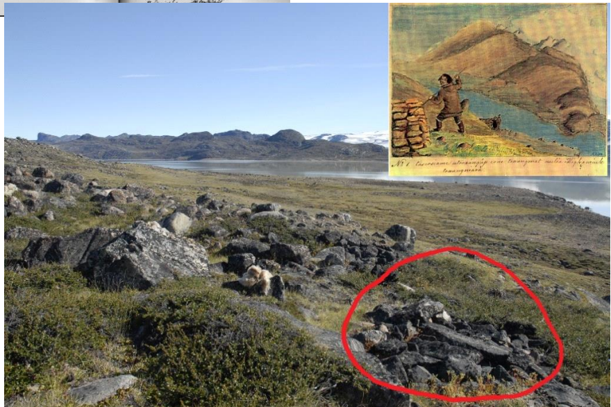
Fig.2 Oqaluttuartalinnik qalipaasartoq Aalut Kangermiu inuusunnerulluni Tasersiamiissimavoq, tappavaniinnermini ilivitoqaq oqaluttuassartalik "Oqalualaarut utoqqanngup erneranik" qalipassimavaa oqaluttuassartaalu allallugu. Ilivitoqaq 2007-imi itsarnisarsiuut misissuinerminni Aalup qalipagaa tunngavigalugu nassaarisinnaasimavaat, ilivitoqarlu innarlerneqarsimangilaq inuttaalu sakkuiulu sulit tassaniipput.