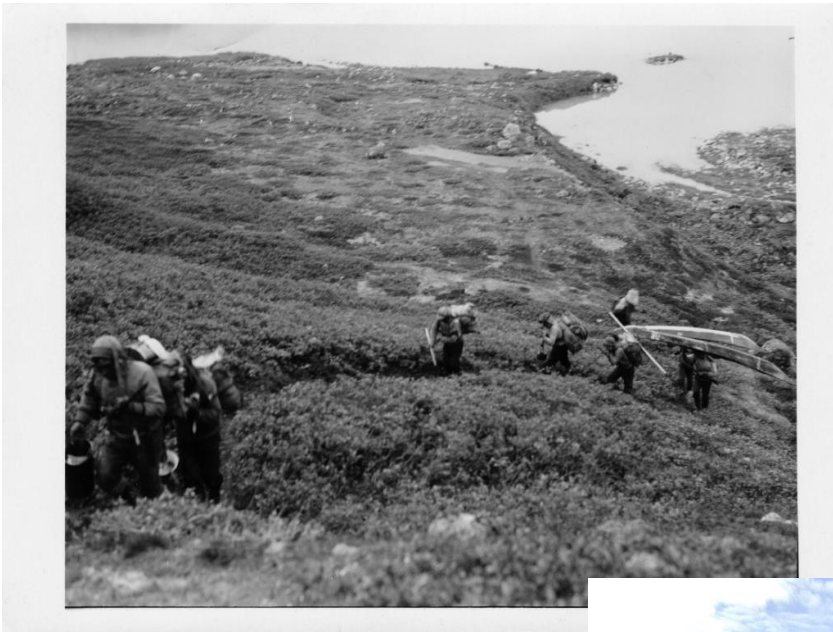
Fig.5 Ukioq 1930 Ujarassuartigoorlutik / Anavik'ut nunap timaanut aavariat. Qaannat nassataat nalunanngitsumik Tarsartuup aammalu Tussaap tasiatigut atugassarigaat.