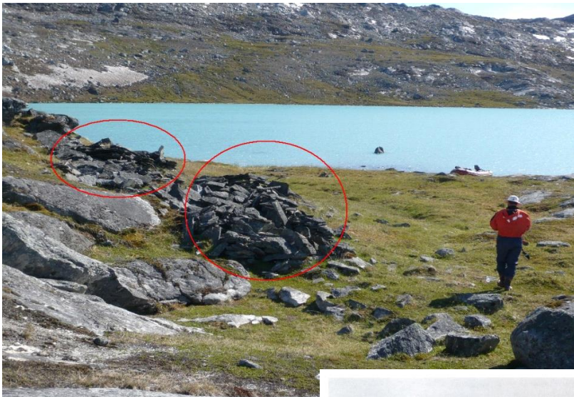
Fig.3 Tarsartuup Tussaallu tasersuani illut ujaraannarnik sanaat assingi uani takuneqarsinnaapput. Piffissap ingerlanerani arlallit illup qaavi nakkaassimasut takuneqarsinnaapput.

B.2 Tarsartuup Tasersua – taseq illunik ujaqqanik immikkuullarissunik peqarfiusoq (assiliartaq 3). Tarsartuup tasersua aammalu eqqaaniittoq Tussaap tasia soorlu Tasersiatuut inoqarfiusimaneranik takussutissaqarpoq tuttunniarnerillu nalaanni angallatnerinik piuniuteqarnerinilli takussutissaqarluartoq (Takussutissaq 1). Sumiffimmi inoqarfiit ikorsimmaviit tallimat takussapput illut qammakkat 50-it angullugit amerlatigisut tamaaniillutik. Illuloriaaseq immikkuullarissuuvoq ammalukannerluni soorlu illuikkiatut sanaajusarlutik kisiannili ujaqqanik kusanarluinnartumik suliaallutik (assiliartaq 3). Illut ujaqqanik qammallit tamakku Kalaallit Nunaanni allani naammattoorneqarsimangillat nalunaarsorneqarsimanatillu, kisianni ilimagineqarpoq Thule kulturimut attuumassuteqartut Nuup Kangerluata qinnguani takussaasarsimassasut (assiliartaq 4).